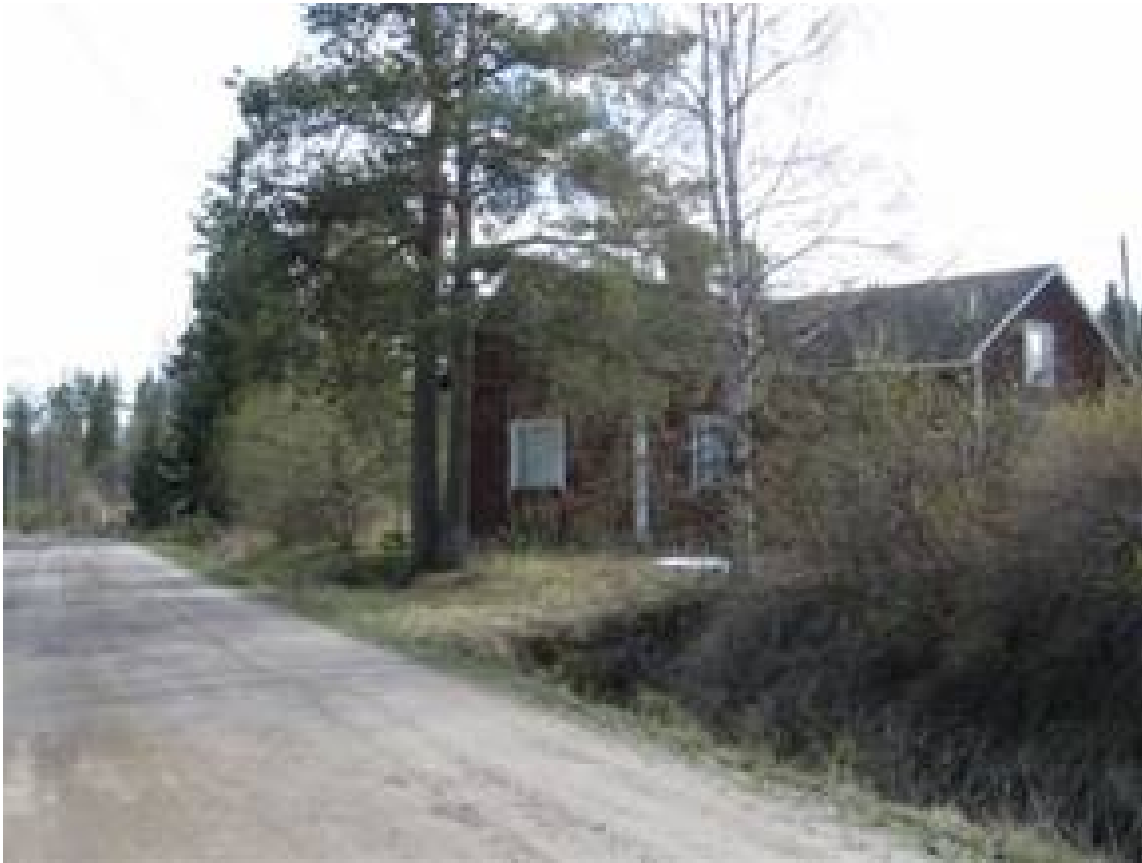
Hemminkankaan talo keväällä 2008,