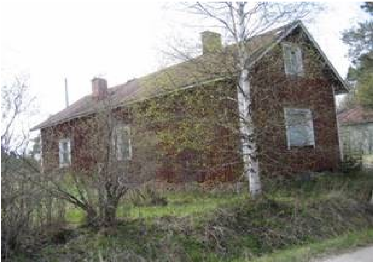
Talon toisessa päädyssä asuivat Kososet. kartta Hemminkankaantie 98, Siikajoki Talo on purettu n. 2010 luvulla